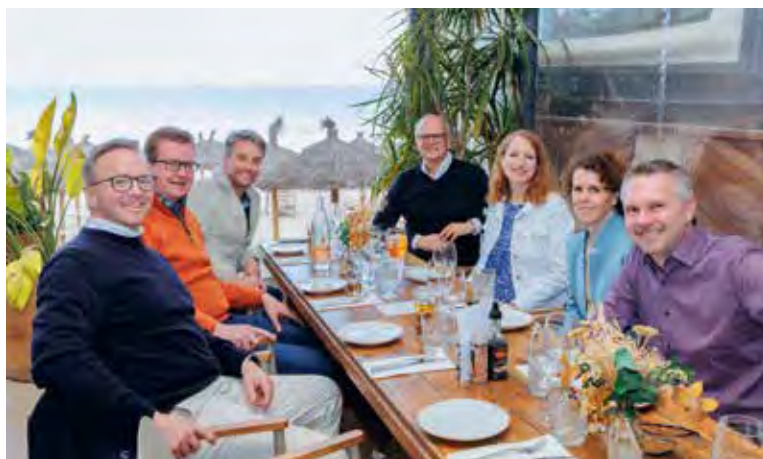
Alle zwei Jahre: unser Seminar auf Mallorca