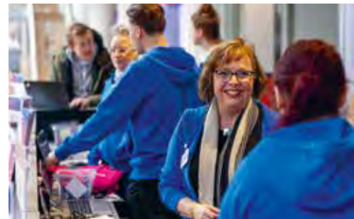
Einlass von über 1.000 Steuermenschen: TAXarena 2024

Seit diesen Anfangstagen konnten wir schon Vieles im Interesse der Mitglieder erreichen. Zum Beispiel die Einführung des Steuerberatergesetzes. Die Gründung des Deutschen Steuerberaterverbandes e. V. als bundesweite Interessenvertretung. Oder auch den Aufbau von Deutschlands meistbesuchtem Fortbildungsangebot für Steuerberaterinnen und Steuerberater sowie vielen weiteren Services.